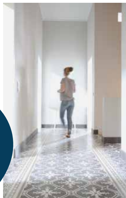
z.B. [viaplatten.de] Zementmosaikfliesen