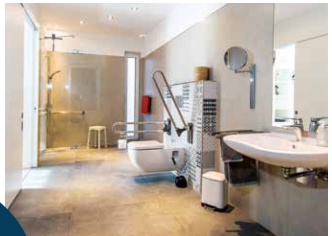
barrierefreies Bad, Bild: Studio PhotoNord