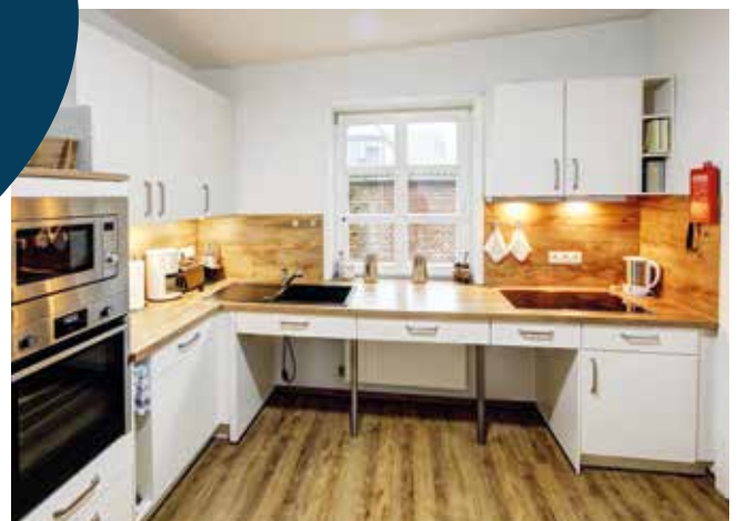
unterfahrbare Küche Ferienwohnung