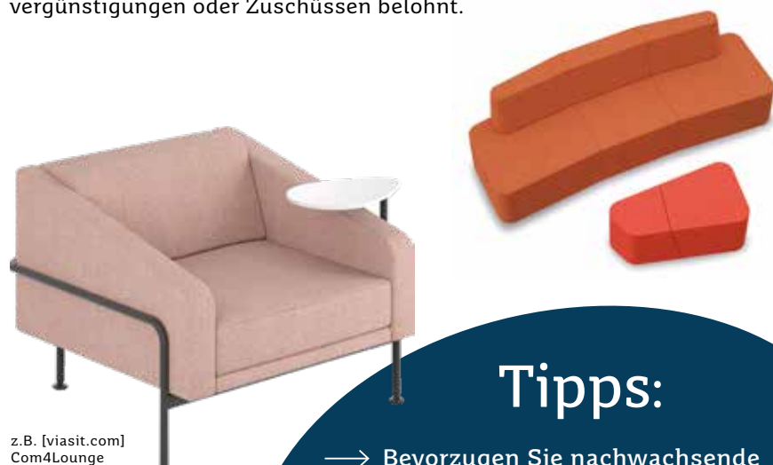
z.B. [viasit.com] Com4Lounge