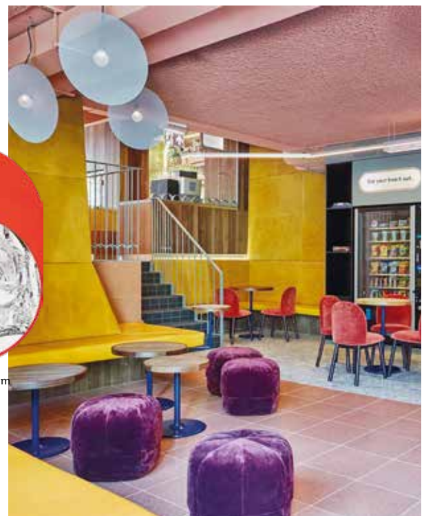
[Hotel City Hub]