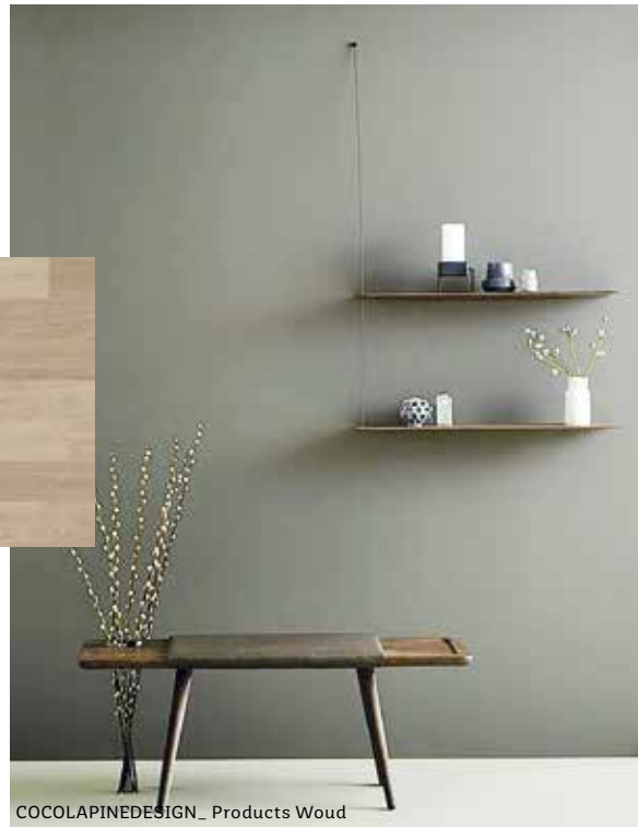
COCOLAPINEDESIGN_ Products Woud