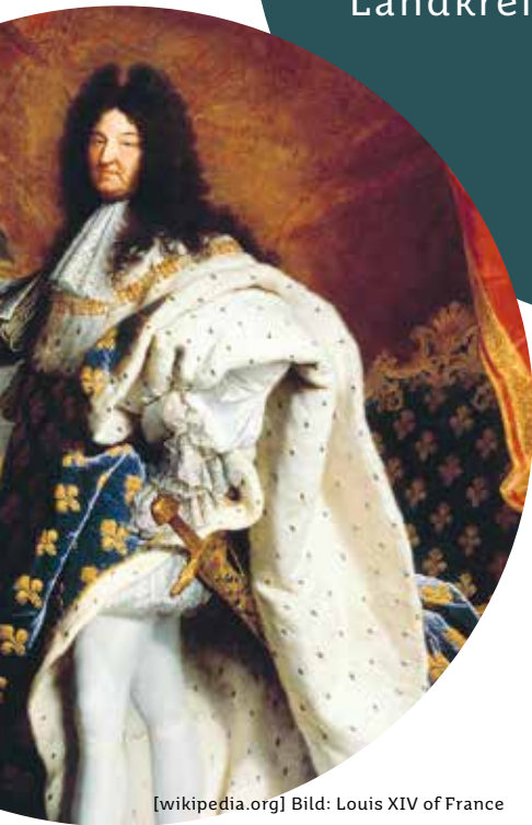
[wikipedia.org] Bild: Louis XIV of France

Merkmale von Landkreisen | Städten | Dörfern