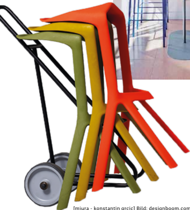
[miura - konstantin gric]