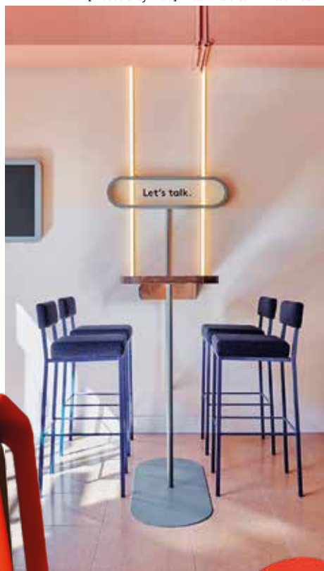
[Hotel City Hub]