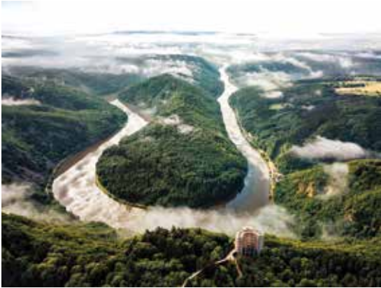
Die Saarschleife