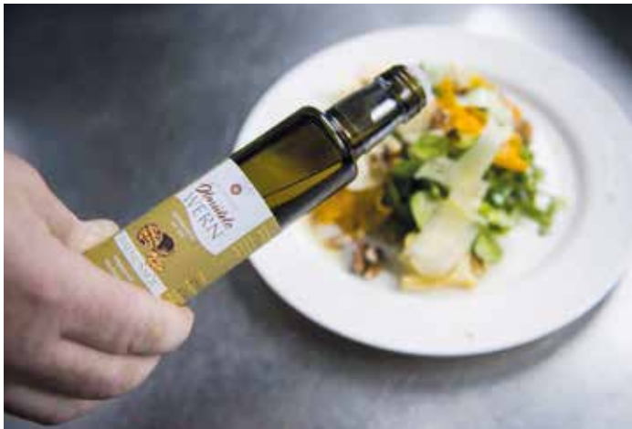
[Tourismus Zentrale Saarland] Markus Simaitis

Suchen Sie sich das Thema aus, was „bei Ihnen dahemm“ präsent ist.